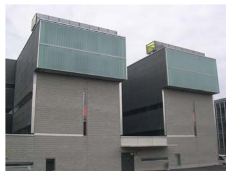
Kuva 3. Lumen ja muiden epäpuhtauksien kulkeutumista estäviä sääsuoja esimerkkikohteessa.

Tuulen vaikutusta lumesta johtuviin ilmanvaihtojärjestelmien käyttöhäiriöihin ja hygieniaongelmiin ei ole tutkittu, mutta sen vaikutus lumen aiheuttamiin ongel-