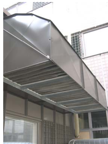
Kuva 5. Karkeasuodattimen käyttöön perustuva lumisuojausratkaisu esimerkki kohteessa.

keasuodattimet tukkeutuvat lumesta lumisade-episodin aikana (Halonen ym., 2000). Karkeasuodattimen täydellinen tukkeutuminen kasvattaa painehäviötä. Karkeasuodattimelta kuiva lumi voidaan poistaa melko helposti ja suodattimen käyttöä voidaan jatkaa, jos suodattimet eivät ole päässeet kastumaan. Esimerkkikohteessa (Kuva 5) karkeasuodattimen käyttöön perustuva lumisuojausratkaisu on osoittautunut toimivaksi ratkaisuksi lumiongelmien estossa.