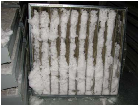
Kuva 1. Lumesta tukkeutunut pussihienosuodatin.

Lumen kerääntyessä toistuvasti kammi-oon voi lumen pinta ylettyä sulkupeltien ja suodattimien tasolle ja pahimmillaan tukkia sulkupellit ja suodattimet (Kuva 1). Tällä tavoin lumesta sulanutta vettä voi joutua suodattimille ja muualle ilmanvaihtojärjestelmään. Lumen tunkeutuminen ilmanvaihtojärjestelmän sisälle on todennäköisintä, jos virtausnopeus ulkoilmasäleiköllä on liian suuri tai raitisilmakammio on pieni tai puuttuu kokonaan (Halonen ym., 2000).